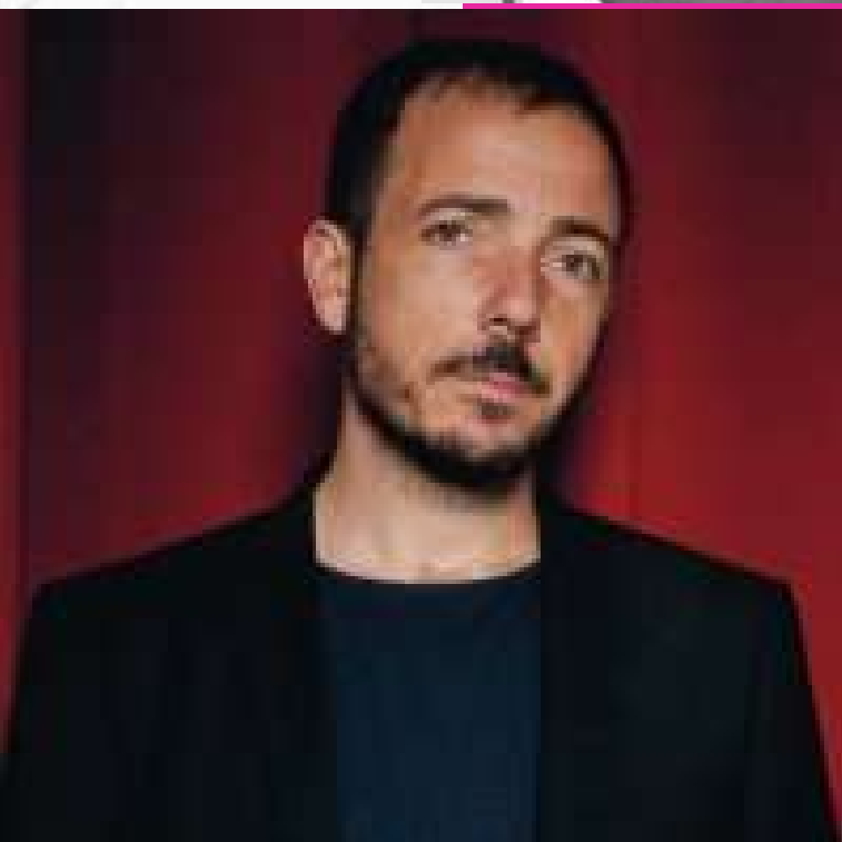
Jaume Ripoll, Filmin